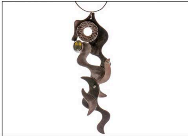
Collana collezione Volcanic Passion in argento e oro