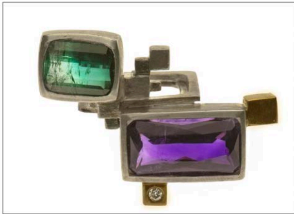
Anello collezione Metropolis in argento con crisoberillo e ametista