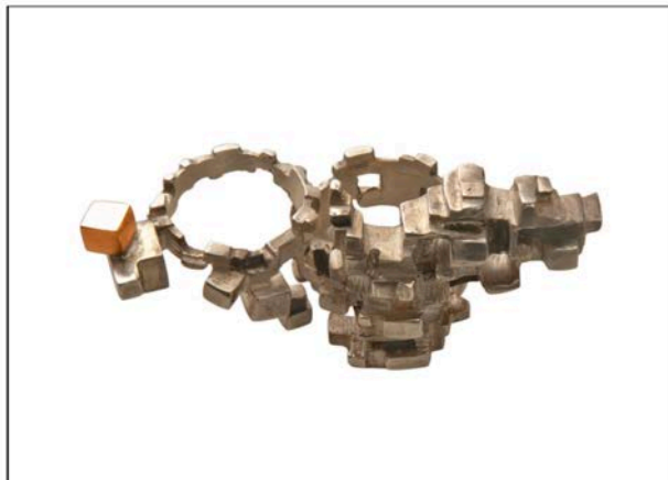
Anello doppio collezione Metropolis in argento