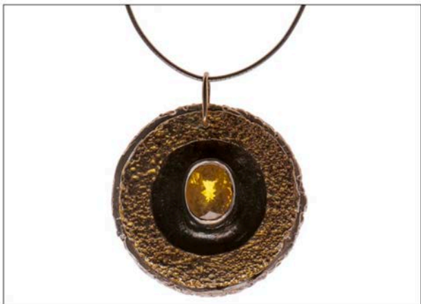
Ciondolo collezione Volcanic Passion in argento oro e quarzo