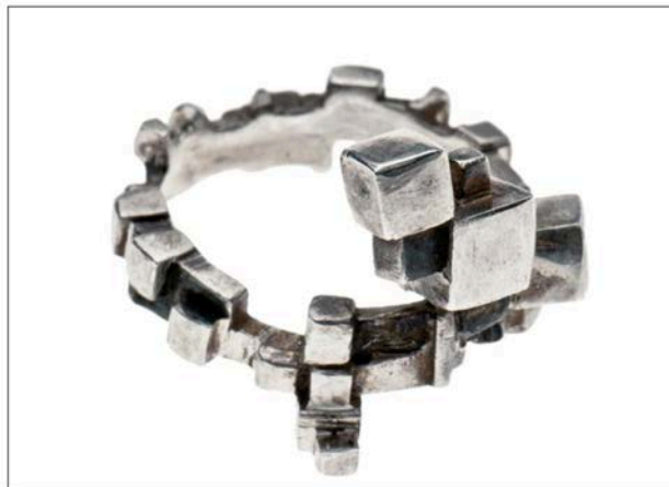
Anello collezione Metropolis in argento