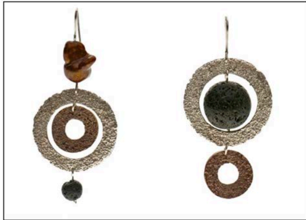
Orecchini collezione Volcanic Passion in argento e oro