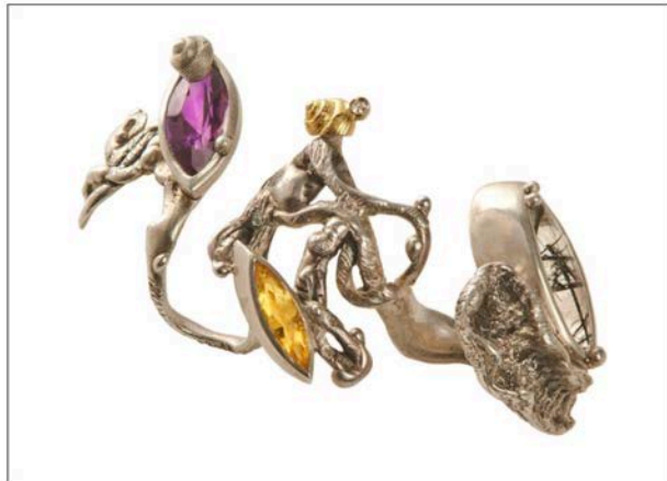
Anello a tre dita collezione Surf'n'turf in argento e pietre semipreziose