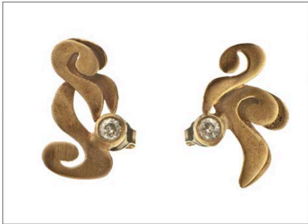
Orecchini collezione New Wave in argento bagnato oro rosa e quarzo