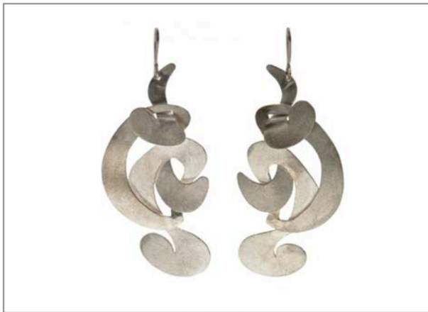
Orecchini collezione New Wave in argento

Son verdaderas joyas de artista las de Mikky Eger, alemana trasladada a Milán con apartamento- laboratorio en el área creativa de Tortona. Esculturas micro y macro con piedras semipreciosas envuelten alrededor del brazo o los dedos. Dondequiera domina el tema de la naturaleza que se expresa en muchas formas: el mar y sus olas grandes están siguiendo unos a otros en las curvas y espirales de colgantes, pendientes y collares de la colección New Wave, en plata y plata chapado en oro rosa o amarillo. Se ven como conchas o caracoles que rodean la piedras semipreciosas talladas y coloridas de la colección Surf'n'Turf, pero en realidad son las dunas de plata en el desierto marroquí. El metal está doblado, torcido y acabado para dar la impresión de movimiento altamente táctil, por ejemplo, en Volcanic Passion, la textura sólo puede ser el de piedra de lava. Desde formas orgánicas a otra realidad, Metropolis, se puede imaginar por el nombre, es el futuro hecho de superposiciones geométricas que crean arquitecturas imaginativas. Sin la ansiedad de la película de Fritz Lang.