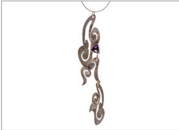
Collana collezione New Wave in argento e pietra semipreciosa